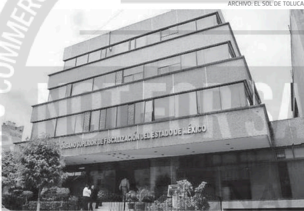
Revisarán si existen acciones que deban emprenderse derivadas de los hechos